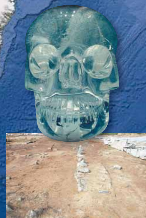
Placa de hielo Laurentina