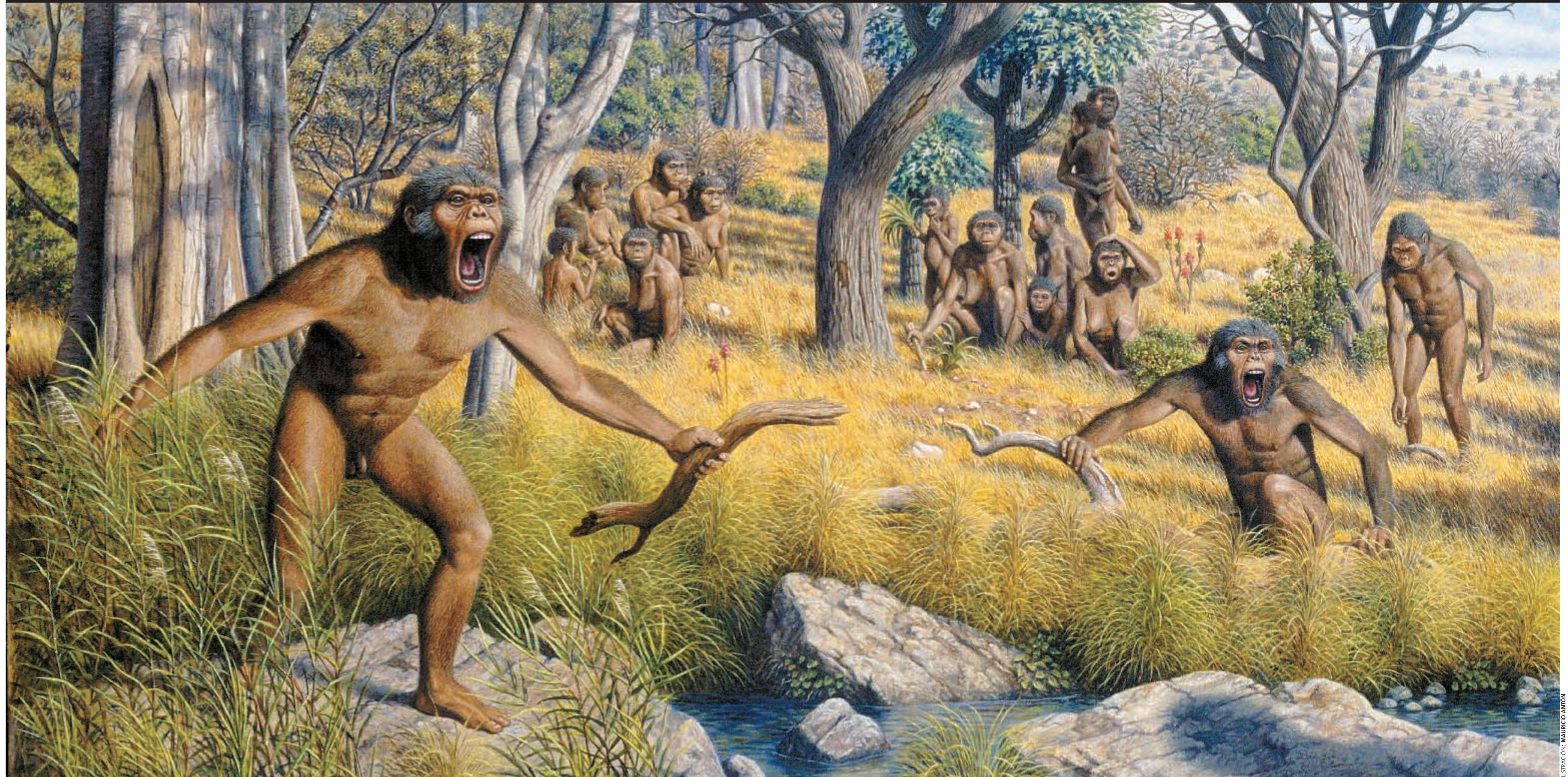
Reconstrucción de un grupo de Paranthropus robustus basado en los hallazgos de Drimolen (Sudáfrica). Excavada desde 1994, esta cueva ha proporcionado 79 restos de varias especies de homínidos datados entre 1,5 y 2 millones de años. Machos y hembras son muy diferentes, los primeros de unos 40 kg y las hembras de 30 kg de peso. Viven en grupos jerarquizados alimentándose de hierbas, tubérculos, raíces, insectos y esporádicamente carne de mamíferos en un medio abierto.

Es muy posible que los primeros instrumentos no fueran realizados por el género Homo . Se han encontrado artefactos líticos junto a los Australopithecus y huesos apuntados junto a los Paranthropus . En varias cuevas de Sudáfrica hay huellas en dichos huesos de que se usaron para acceder a los termiteros, seguramente para comer dichos insectos. También los estudios de la mano de los Paranthropus son concluyentes al afirmar que poseían todas las habilidades necesarias para hacer y agarrar instrumentos.