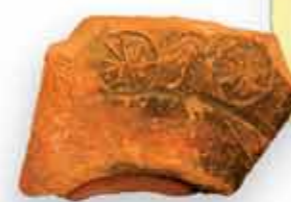
FRAGMENTO DECORADO PERTENECIENTE A UN CUENCO DE Terra Sigillata

Durante el Calcolítico o Edad del Cobre (niveles, 7-8 y 6) el yacimiento presenta evidencias de haber sido utilizado también como un espacio funerario. En una estructura tumular, aunque parcialmente destruida en tiempos recientes, hemos recuperado piezas de ajuares, fragmentos cerámicos y una serie de huesos humanos entre las piedras que confirman la teoría del uso sepulcral de la cavidad en este momento. Esta evidencia se relaciona con el conjunto megalítico del pueblo de Atapuerca y otros túmulos en las cercanías de la Sierra.