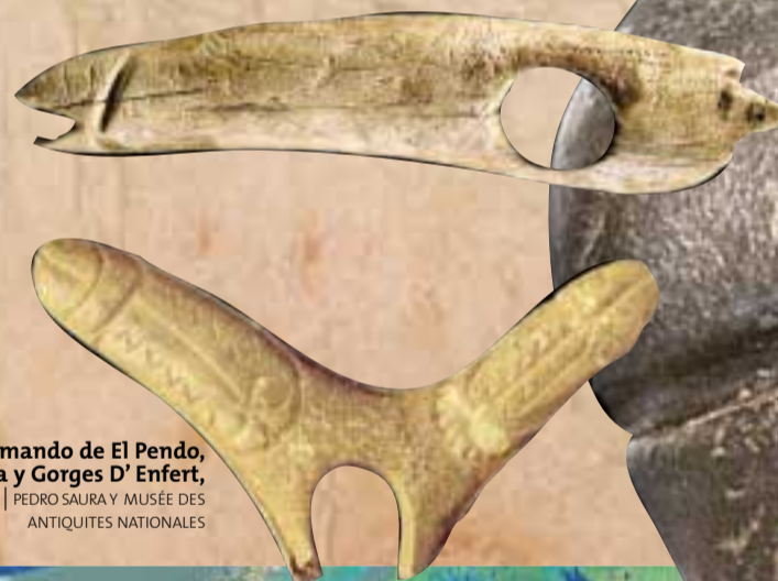
Bastones de mando de El Pendo, Cantabria y Gorges D' Enfert, Francia | PEDRO SAURA Y MUSÉE DES ANTIQUITÉS NATIONALES

El sexo se vuelve explícito al final del Paleolítico (hace unos 15.000 años). La reproducción ya no es el principal motivo de plasmación. Se asiste a una explosión de falos y venus que parecen sugerir mundos menos materiales, más placenteros y eróticos con más ensañaciones.