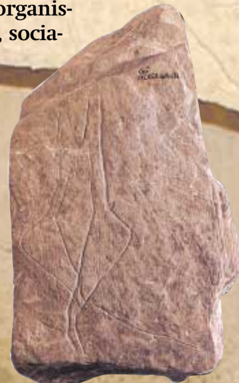
Placa de Gönnersdorf, Alemania | © BOSINSKI