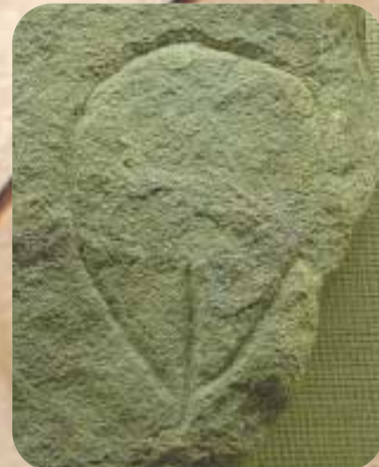
Vulva grabada en Le Blanchard, Francia | MUSÉE DES ANTIQUITÉS NATIONALES