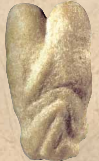
Caliza esculpida de Ain Sakhri, Judea