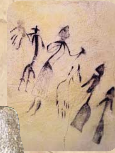
Pintura de Cogull, Lérida.