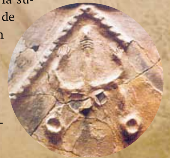
Grabados y datalle cerámica de Galería de Sílex, Cueva Mayor | S. DOMINGO Y J.M. APELLÁNIZ

Han sido interpretadas por algunos autores como figuras sexuales que muestran sus atributos, tanto masculinos como femeninos.