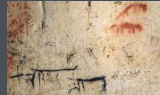
Panel principal de la Galería del Sílex

Desde el Neolítico y durante la Edad del Bronce, encontramos grabados y pinturas rojas y negras en todo el complejo de Cueva Mayor. Se trata de signos, formas geométricas y figuras esquemáticas y abstractas del mundo ideológico, que son plasmadas en los techos y paredes de la cueva.