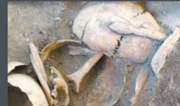
Sepultura en fosa localizada en El Mirador

Desde el Paleolítico apreciamos en Atapuerca que la muerte es comprendida, pero es hace unos 3.500 años cuando se despliegan complejos rituales de manipulación y enterramiento de los cadáveres. Los dólmenes, túmulos y fosas que se realizan formarían parte de las actividades que unen la estructura social y el mundo simbólico.