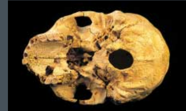
Parte inferior del cráneo 5 de la Sima de los Huesos

Los estudios realizados sobre los Homo heidelbergensis de Atapuerca indican que su anatomía y rasgos biológicos, el nivel tecnológico, su articulación social y sus estrategias de subsistencia y ocupación del territorio corresponden a grupos que disponen de un lenguaje, mapas mentales, capacidad de abstracción y proyección mental.