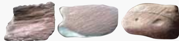
Fragmentos de ocre trabajados para sacar pigmentos de Blombos Cave