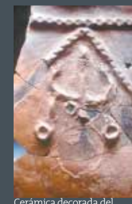
Cerámica decorada del Portalón | SALVADOR DOMINGO

En la Edad del Bronce, los grupos de la Galería del Sílex reprodujeron en paredes y vajilla cerámica sus imágenes mentales. Esta figura humana, quizá femenina, no tiene una clara significación para nosotros, y puede corresponder a una deidad, una danza o una alegoría relacionada con el mundo de los muertos.