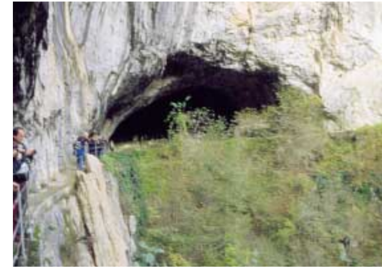
Una de las entradas de la cavidad de Skocjanske , Patrimonio de la Humanidad, seccionada por la Dolina de hundimiento, Velika (Parque de Skocjanske jame, Dívica, Eslovenia)

expuso el ejemplo de los yacimientos de Atapuerca como la extraordinaria capacidad que tienen las cuevas de conservar los registros sedimentarios que albergan en su interior. La investigadora de la UBU defendió que a la hora de valorar un karst se han de tener en cuenta no solo sus características geológicas sino también sus valores paleontológicos y biológicos. Se realizó un listado de los karst existentes en España que se presentará en el próximo congreso, a celebrar en Atenas en el 2005.