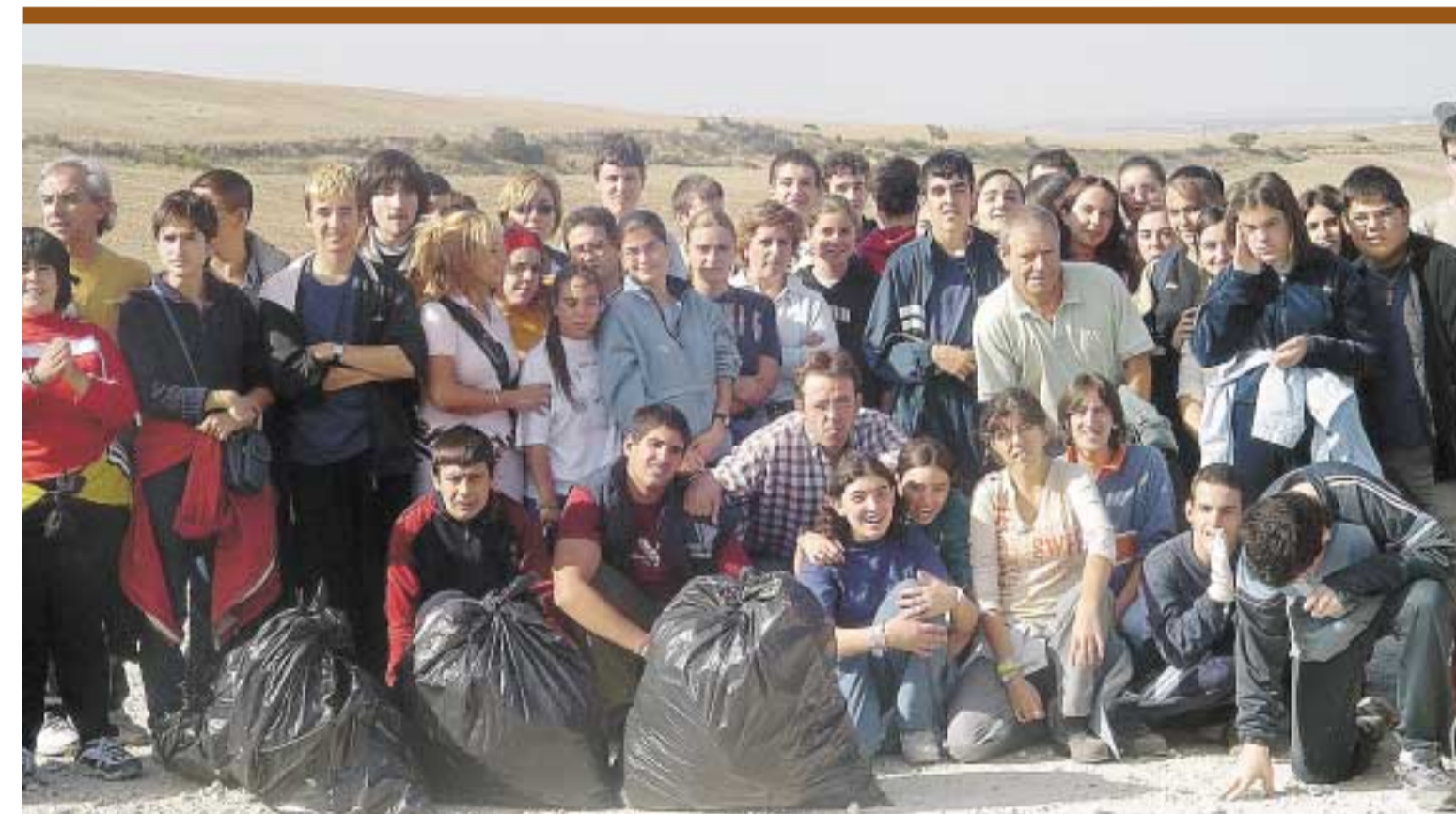
Los jóvenes y profesores del IES Cardenal López de Mendoza y Aspanias compartieron una jornada de convivencia en la Sierra