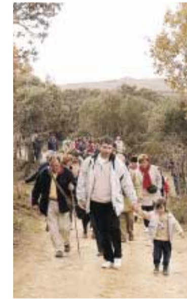
Sin distinción de edades, 650 personas participaron en la II Marcha a pie a la Sierra | OEB

padres de personas con discapacidad intelectual) y se programaron diversas actividades, entre las que se encuentra esta jornada de convivencia. El 3 de Octubre de 2003 y el 8 de Octubre de 2004, en las zonas designadas para la visita libre de los yacimientos, 60 jóvenes estudiantes del último curso de Bachillerato Internacional del I.E.S. Cardenal López de Mendoza de Burgos y 30 jóvenes con discapacidad del Centro de Formación de Puentesauco (ASPANIAS), supervisados por profesores de los centros educativos y personal de la Fundación Atapuerca, compartieron una jornada