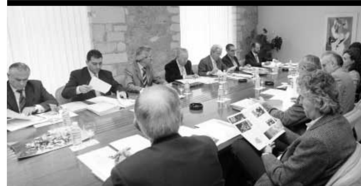
Reunión del Patronato de la Fundación Atapuerca

La publicación se encuentra disponible en las librerías, centro de recepción y visitas a los yacimientos y en la propia Fundación ( www.fundacionatapuerca.es ) y su precio es de 30 euros.