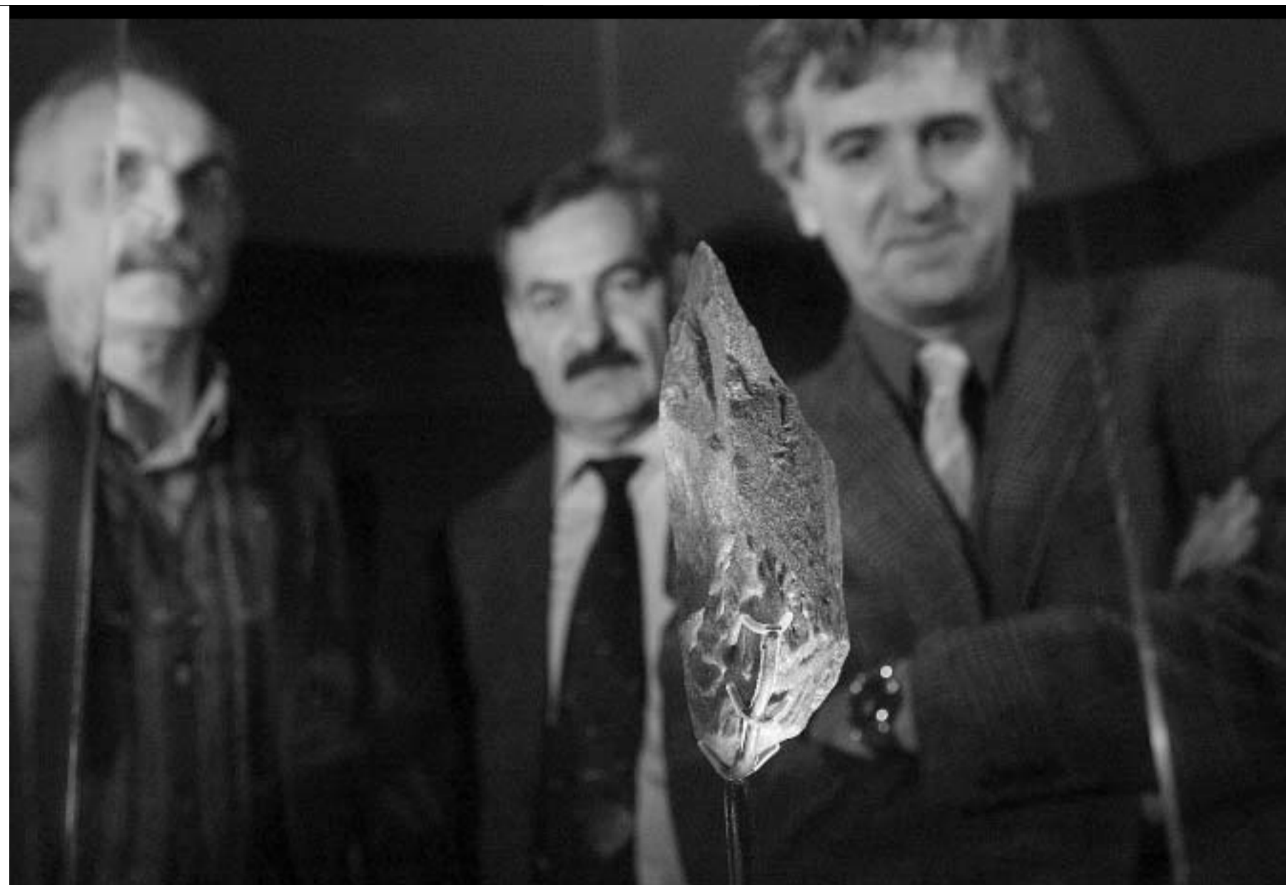
Los codirectores contemplan a Excalibur en el Museo de Ciencias de Nueva York. | ALBERTO RODRIGO

Una cosa sí ha quedado clara, a mi entender: quienes quiera que fuesen las poblaciones que ocuparon tempranamente el Cáucaso, no necesitaron poseer un cerebro especialmente grande, como hasta hace muy poco se pensaba. De hecho, el incremento cerebral y corporal del Homo ergaster africano, respecto a las formas anteriores, parecía haberse constituido en condición sine qua non para la incursión de estas poblaciones fuera de África. Los hallazgos de Dmanisi demuestran, por contra, que la capacidad craneal de estos homínidos se mantenía entre 600 y 700 cc. Es decir, un volumen típico de las formas primitivas de Homo.