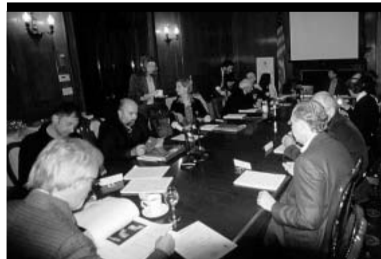
Reunión de trabajo de los científicos en Nueva York. | MARINA MOSQUERA