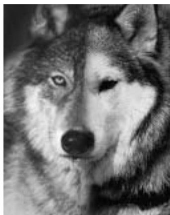
Lobo y husky, primos hermanos. Montaje fotográfico realizado con las imágenes de un lobo (l) y un husky (d).

Un estudio llevado a cabo por Peter Savolainen y Carles Vilà sobre el ADN de diversos perros procedentes tanto del Viejo Mundo como del continente americano apunta a que su domesticación surgió en el este de Asia, hace unos 15.000 años, y que se fue expandiendo rápidamente por Europa hasta alcanzar, junto a los humanos, el estrecho de Bering y tierras ame-